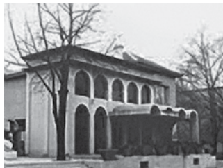
Davne 1954. godine utemeljeno je Pionirsko amatersko kazalište sa sjedištem na današnjoj adresi, 1969. godine ono postaje Malo kazalište "Trešnjevka", a početkom osamdesetih mijenja naziv u Kazalište "Trešnja"

Naraštaji već desetljećima kreću na bajkovita putovanja zahvaljujući uprizorenjima priča koja potiču maštu. Tako je od "Crvenkapice" u režiji Nade Kubinek, prve predstave odigrane u trešnjevčkom kazalištu, pa do "Ljepotice i Zvijeri" u režiji Dore Ruždjak Podolski, predstave koja je rušila rekorde gledanosti kao i u svjetskim kazališnim središtima. Mnogo je važnih predstava, a od osnutka do danas možemo navesti i "Timpetil, grad bez roditelja" (prva nagrada na Prvom festivalu