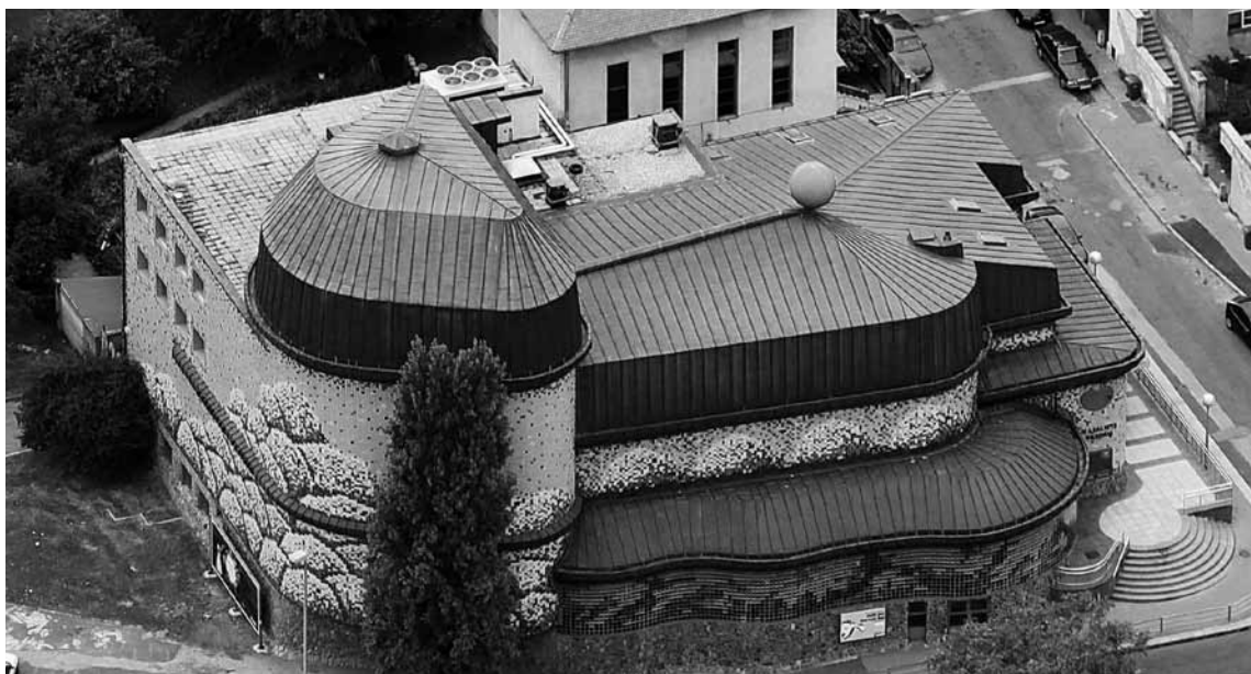
Današnje zdanje Kazališta "Trešnja"

Zanimljiv je dio ponude i proslava dječjih rođendana. Dovoljno je mjesec dana prije odabrati predstavu za koju se ulaznice plaćaju po povoljnijim cijenama. Za slavljenika i njegove uzvanike osigurana su mjesta u prvom redu, a tijekom predstave brigu o gostima preuzimaju domaćice kazališta, inače zadužene za informiranje i prodaju ulaznica na blagajni kazališta. Nakon predstave slijedi fotografiranje s glumcima i mogućnost nastavka proslave u Klubu GK "Trešnja" uz zabavne igre koje organizira dramska pedagoginja Maja Kovač. Time se jednostavno ispisuje poruka: "Bili ispred scene, na sceni ili iza nje – jedan je život."