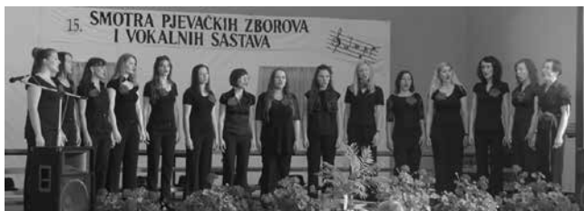
Ženska vokalna grupa Pjevačkog zbora JOSIP ŠTOLCER SLAVENSKI, Čakovec