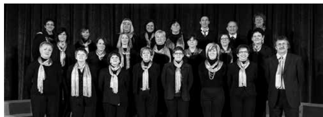
Mješoviti pjevački zbor KORONA, Umag