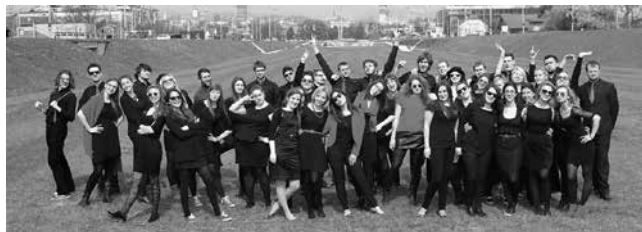
Akademski zbor Filozofskog fakulteta u Zagrebu CONCORDIA DISCORS