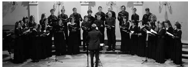
Pjevački zbor Pravnog fakulteta u Zagrebu CAPELLA JURIS