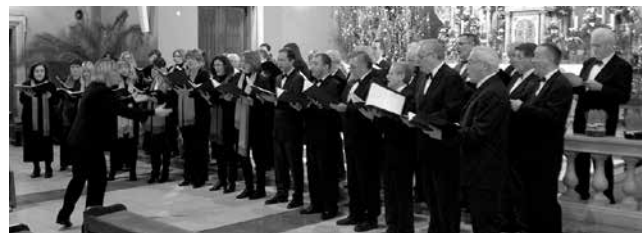
Akademski zbor VLADIMIR PRELOG, Zagreb