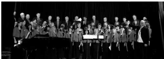
Gradski mješoviti pjevački zbor VILA VELEBITA, Gospić