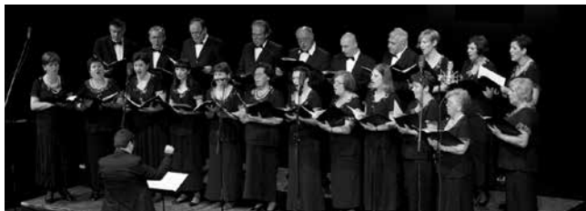
Mješoviti pjevački zbor IVAN KUKULJEVIĆ SAKCINSKI, Zagreb