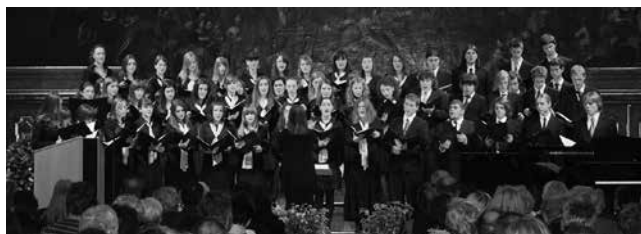
Mješoviti zbor GLAZBENE ŠKOLE U VARAŽDINU