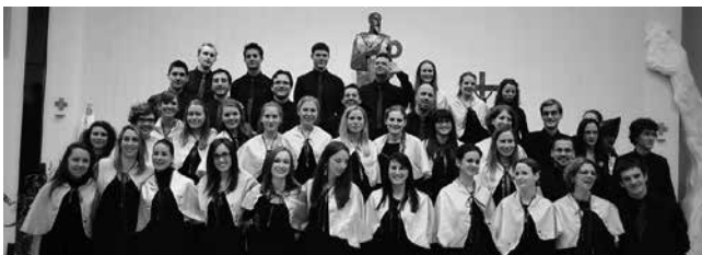
Mješoviti pjevački zbor CAPELLA MIÉRCOLES, Zagreb