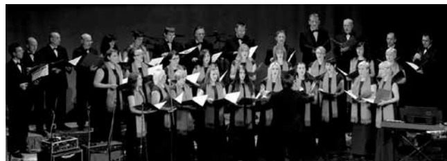
CHORUS CAROLOSTADIEN, Karlovac