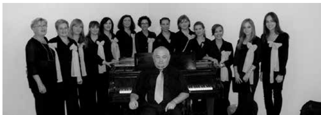
Ženski zbor Kulturno-umjetničkog društva DRAGUTIN DOMJANIĆ, Adamovec