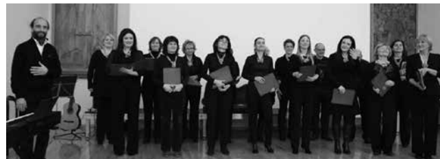
Gospel zbor SUNCE, Zagreb