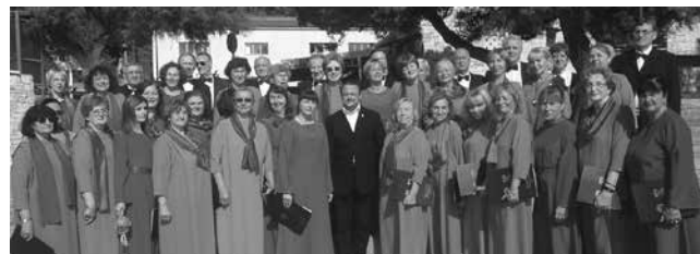
Mješoviti pjevački zbor EMIL COSSETTO, Zagreb