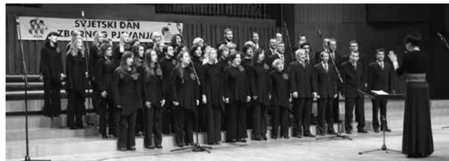
Pjevački zbor JOSIP ŠTOLCER SLAVENSKI, Čakovec