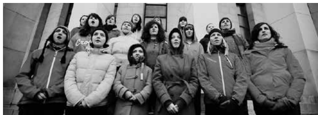
LE ZBOR, Zagreb