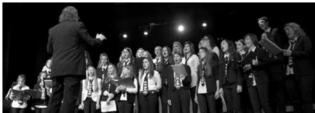
Zbor ČAROBNA FRULA, Zagreb