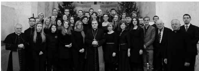
CANTORES SANCTI MARCI, Zagreb