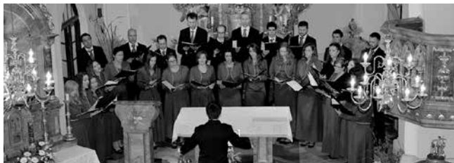
Akademski zbor Bazilike Srca Isusova u Zagrebu PALMA