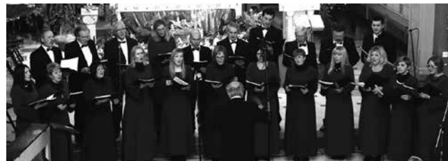
Mješoviti pjevački zbor DESIDERIUM-ČEŽNJA, Zagreb